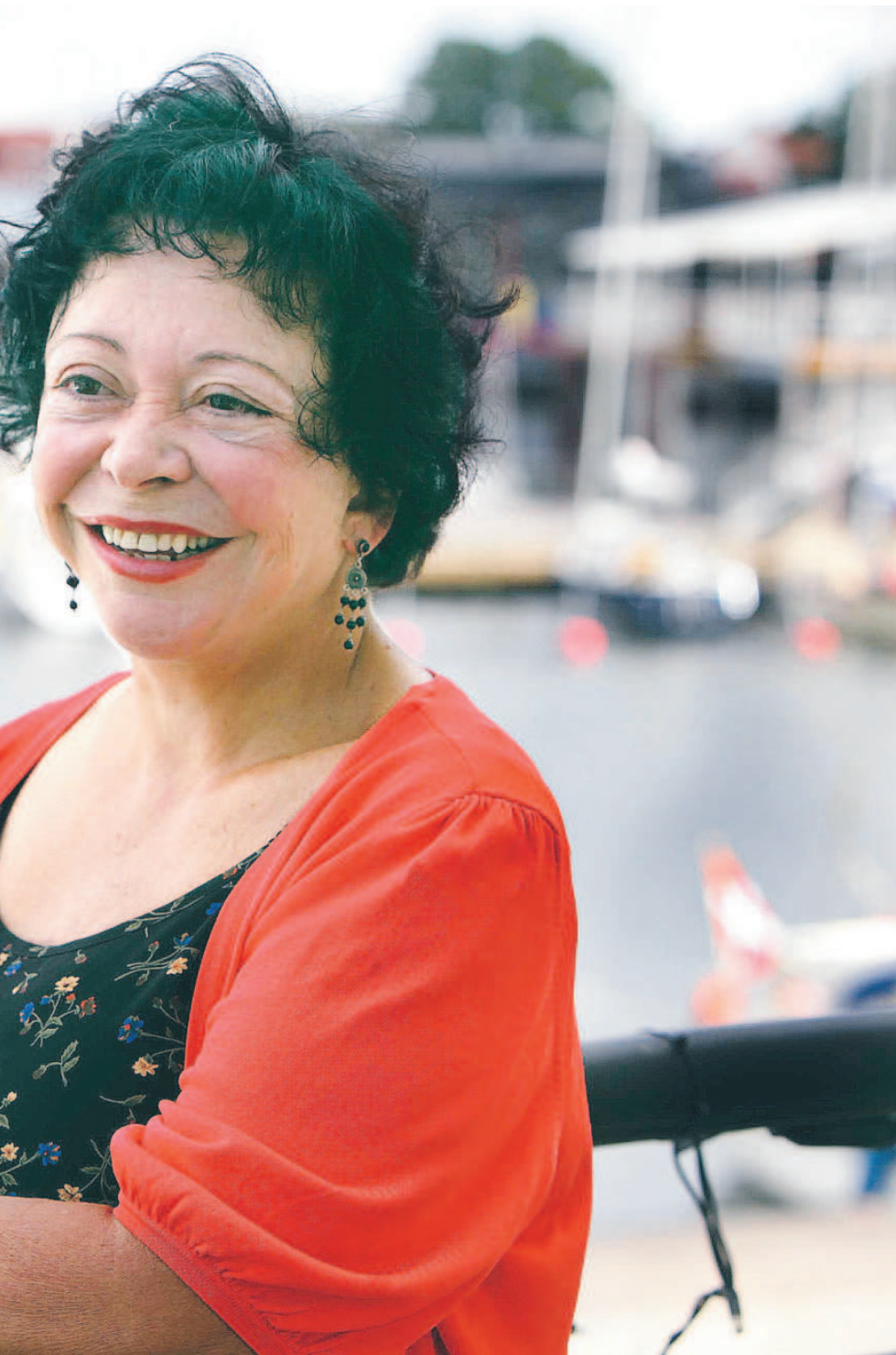
tycker kan något. Det var inte efter kvotering.